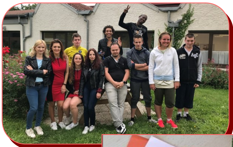
Quelques élèves de dernière année...